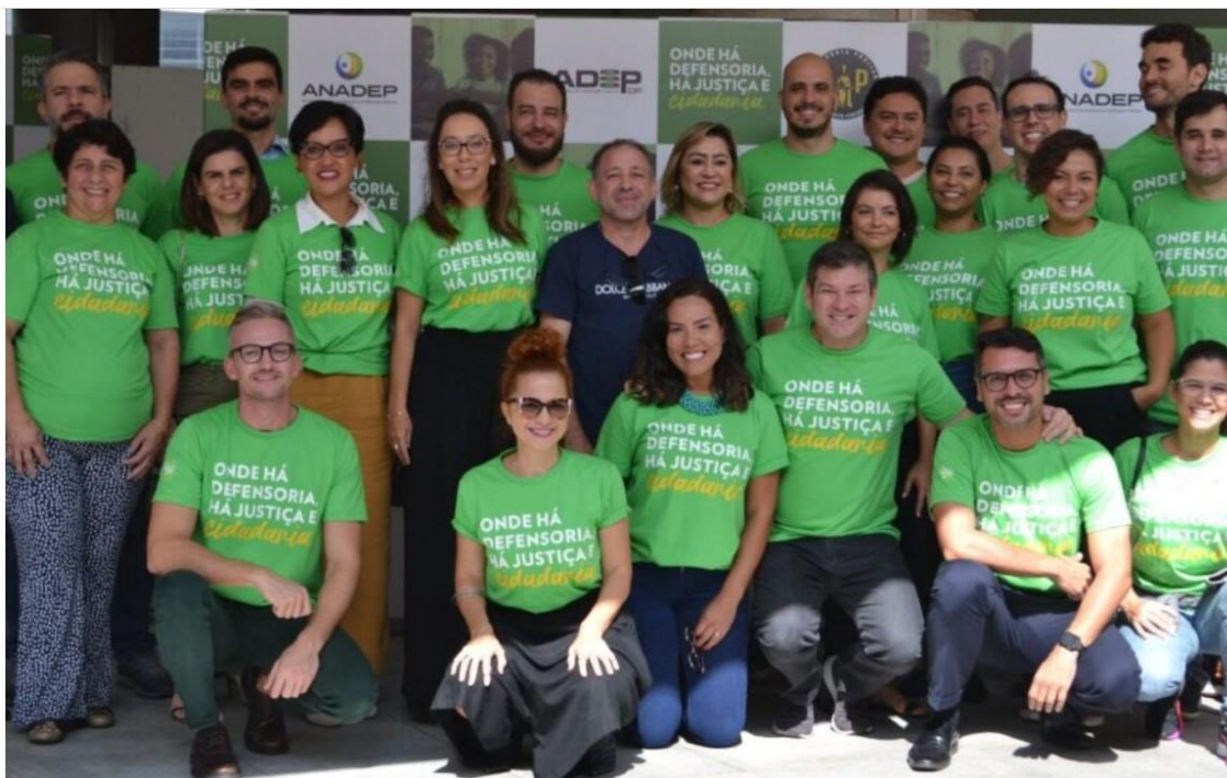
Tema da campanha é "Onde há Defensoria, há justiça e cidadania"