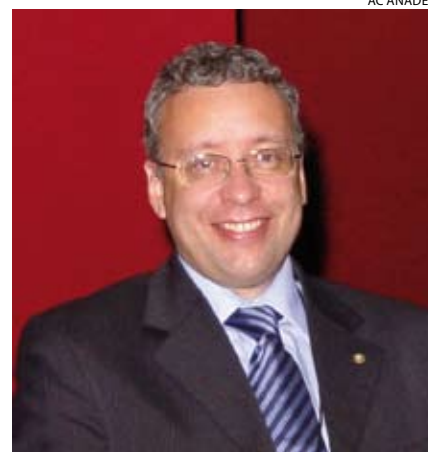
FERNANDO CALMON – PRESIDENTE DA ASSOCIAÇÃO NACIONAL DOS DEFENSORES PÚBLICOS (ANADEP)

“Aos poucos, estamos ampliando o número de defensores por meio de concurso. Só este ano, o Distrito Federal e os estados de São Paulo, Rio Grande do Sul, Mato Grosso e Pará somam 427 novos defensores empossados”.